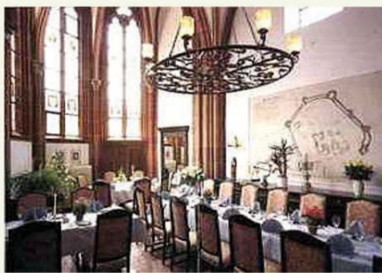
Innenansicht Petruskapelle Anfang 16. Jh.