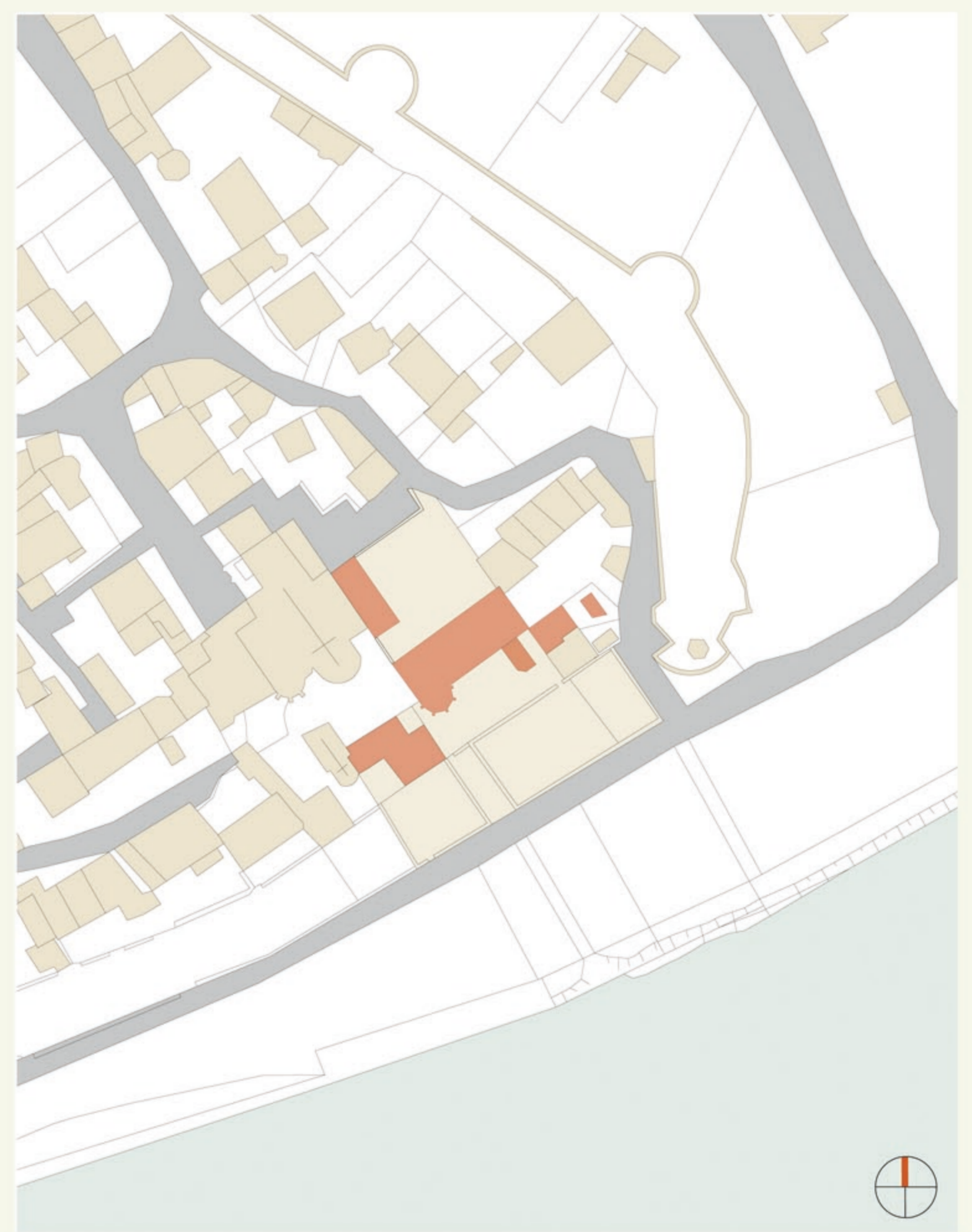
Lageplan M 1:1000