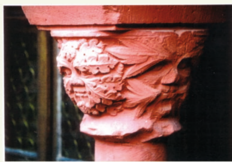
Blattmasken am Kapitell des südlichen Kreuzgangflügels