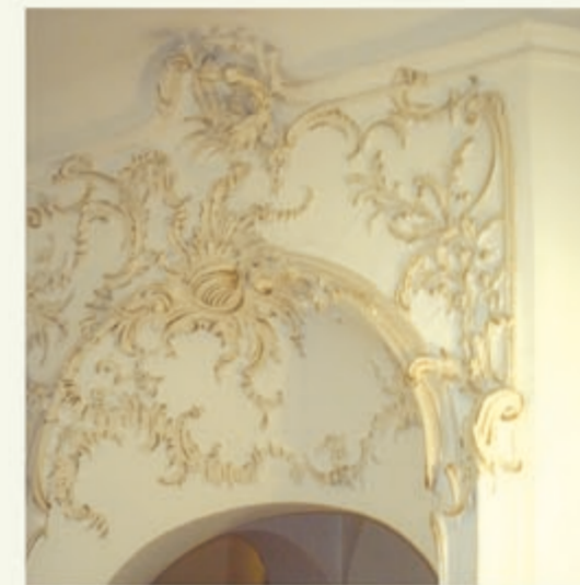
Barocker Kamin im Hotelflur 1.OG

Kanonikerstift: Nur der südliche Kreuzgangflügel mit fünf Jochen ist noch erhalten. Flache Bogen auf Pfeilern in rotem Sandstein überspannen je drei Spitzbögen, die auf Säulen ruhen, deren Kapitelle mit Blattwerk, Trauben und Masken verziert sind. Der östliche Kreuzflügel ist noch in seinem Fundament sichtbar.