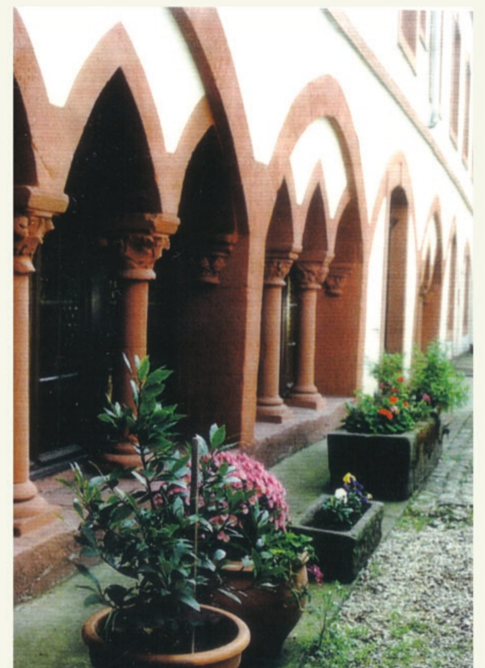
Noch erhaltener Kreuzgangflügel im nördl. Hof der Klosterchenke

Zugänge zum Kreuzgang befanden sich im östlichen Querhaus und neben der Petruskapelle von der Freifläche vor der Apsis her. In den an der Westseite der Petruskapelle angelehnten Bogenrisaliten soll großflächig eine Öberszene angebracht gewesen sein, von der Relieffragmente erhalten sind.