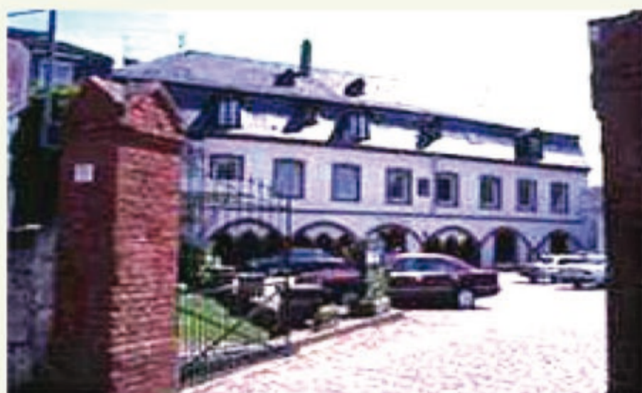
Nördl. Hof zur Klosterchenke: ehemalige Lage des Kreuzgangs

Zugänge zum Kreuzgang befanden sich im östlichen Querhaus und neben der Petruskapelle von der Freifläche vor der Apsis her. In den an der Westseite der Petruskapelle angelehnten Bogenrisaliten soll großflächig eine Öberszene angebracht gewesen sein, von der Relieffragmente erhalten sind.