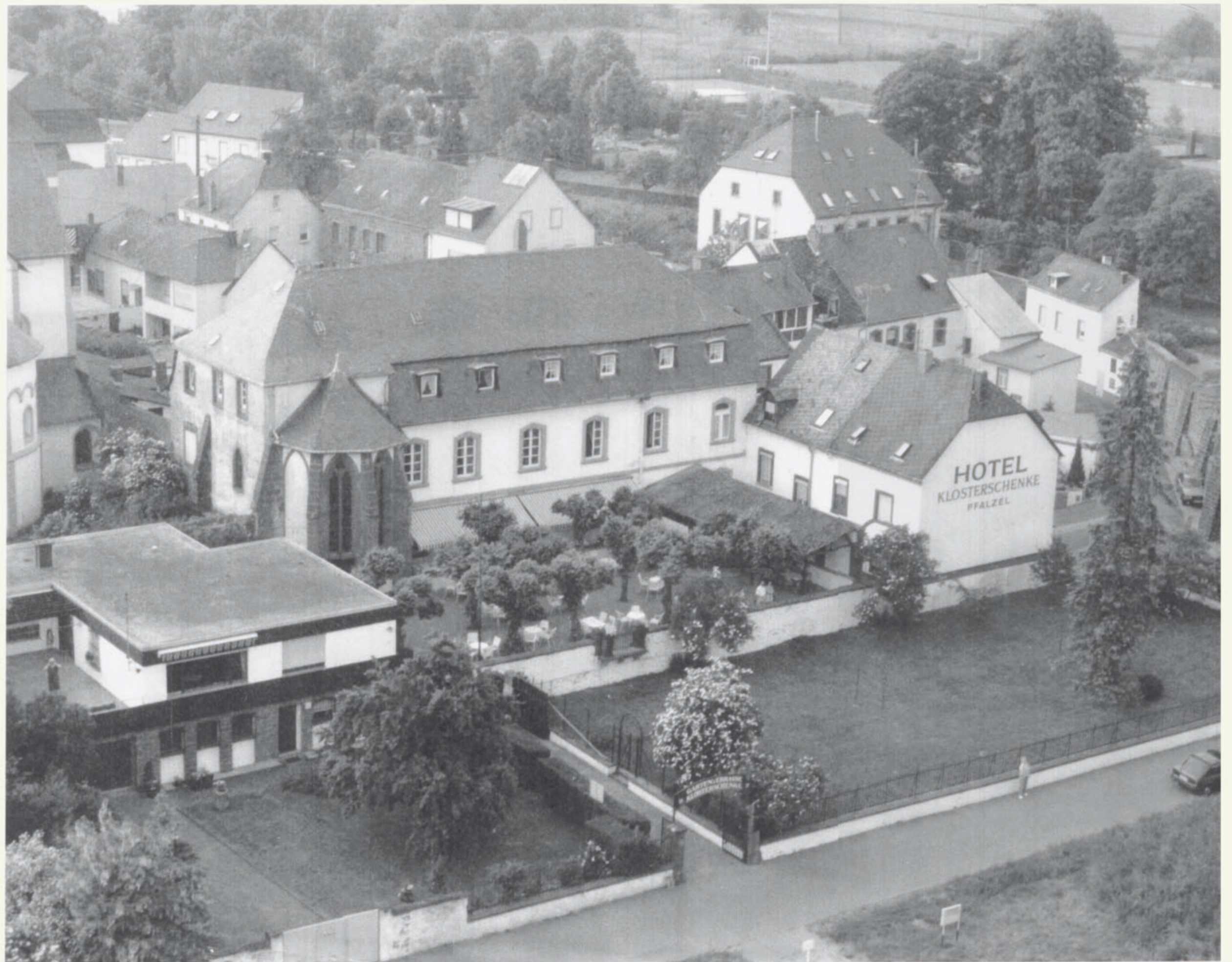
Luftaufnahme ‚Hotel Restaurant Klosterchenke‘ mit Nebengebäuden

Von 1794 bis 1814 war Pfalz Sitz eines Friedensgerichtes und einer Kantonsverwaltung. Jedoch durch die Kriegswirren des 30-jährigen Krieges und später in der Geschichte die erneute Zerstörungen durch französische Truppen, die den Ort im auslaufenden 18. Jh. passierten, war das einst reiche Städtchen in Armut und Verfall geraten.